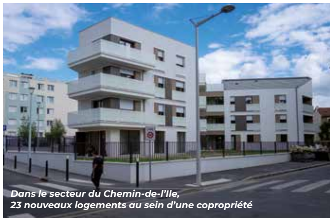
Dans le secteur du Chemin-de-l'Île, 23 nouveaux logements au sein d'une copropriété