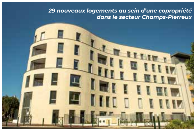
29 nouveaux logements au sein d'une copropriété dans le secteur Champs-Pierreux