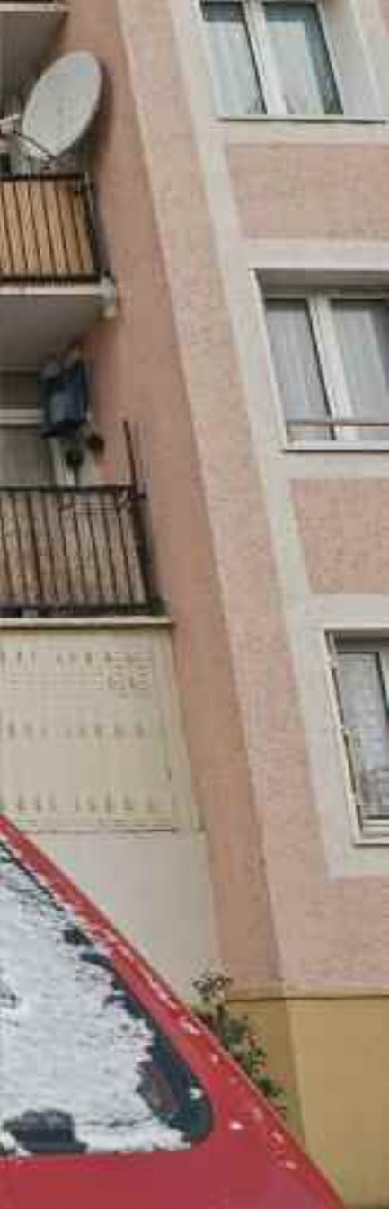
▲ Petit Nanterre