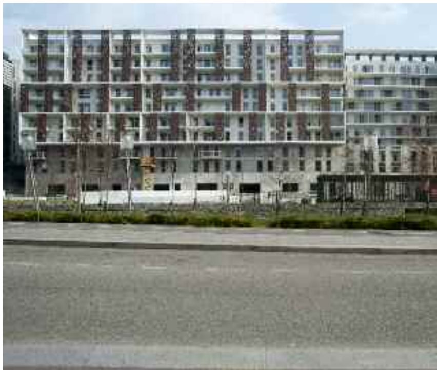
▲ Terrasse 17, quartier Préfecture