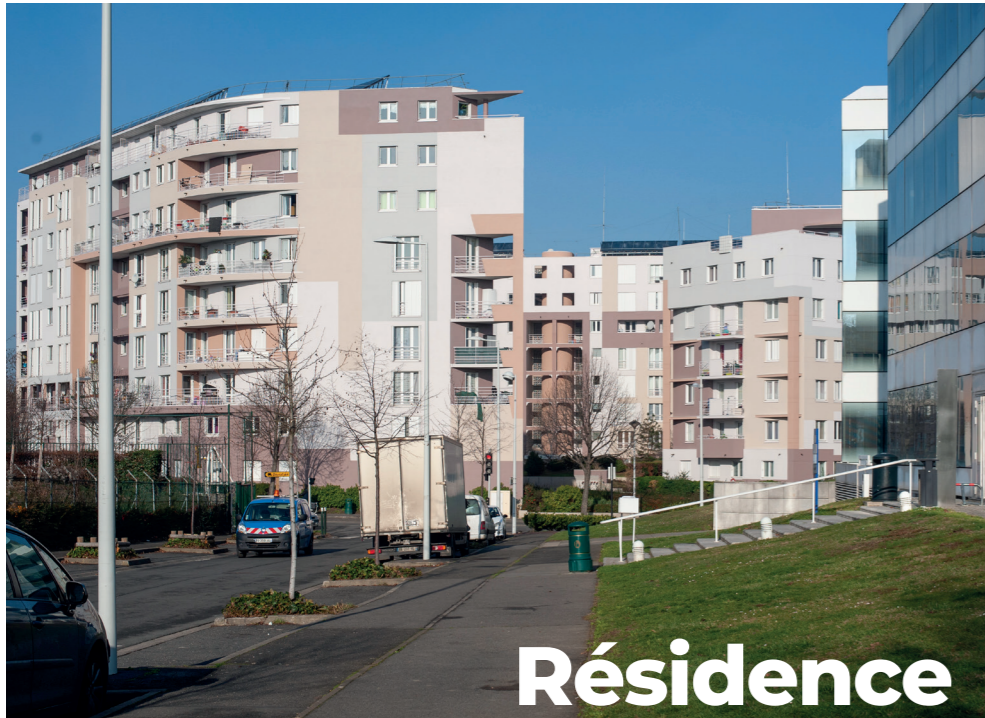
Résidence Les Carriers