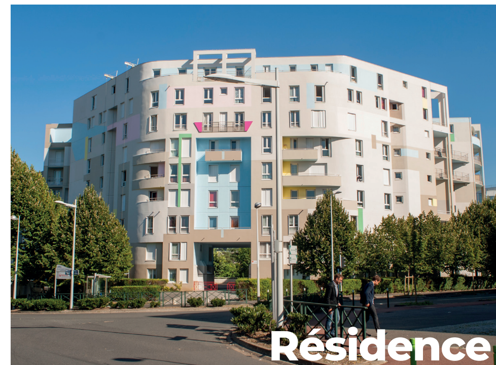
Résidence Les Fontaines