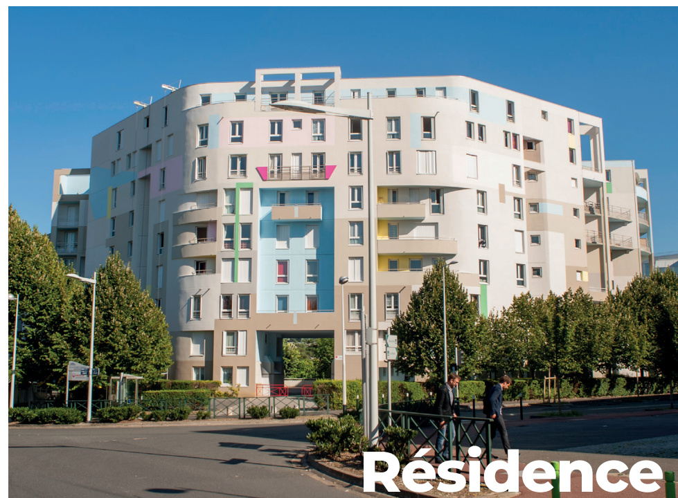
Résidence Les Fontaines